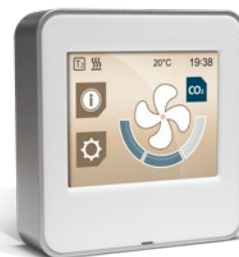
ISYteq Touch 3.5 kontrollpanel

Aggregaten har en roterande värmeväxlare med steglös varvtalsreglering vilket medför mycket noggrann temperaturreglering. Som tillval finns en funktion för begränsning av fuktåterföring. VillaMASTER-aggregaten är utrustade med FläktGroup styrsystem ISYteq Mini kompletterat med en kontrollpanel - ISYteq Touch 3.5.